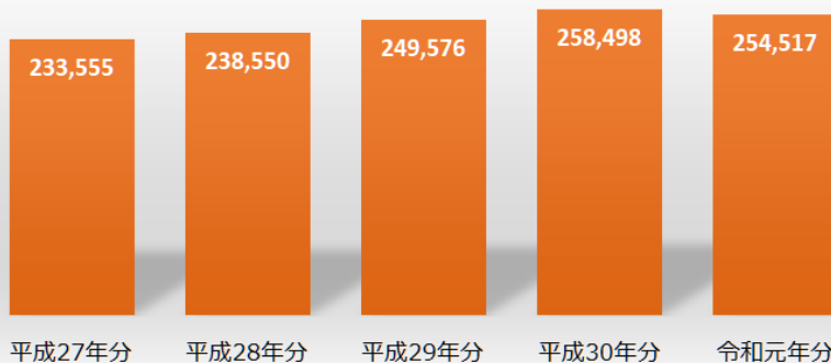
相続税の納税者である相続人数の推移（人）

平成 27 年分以降、課税割合はそれまでの 2 倍程度で推移しています。高齢化の進展に伴い被相続人も増加を続けていることから、今後も相続に関係する人は増えるものと思われます。